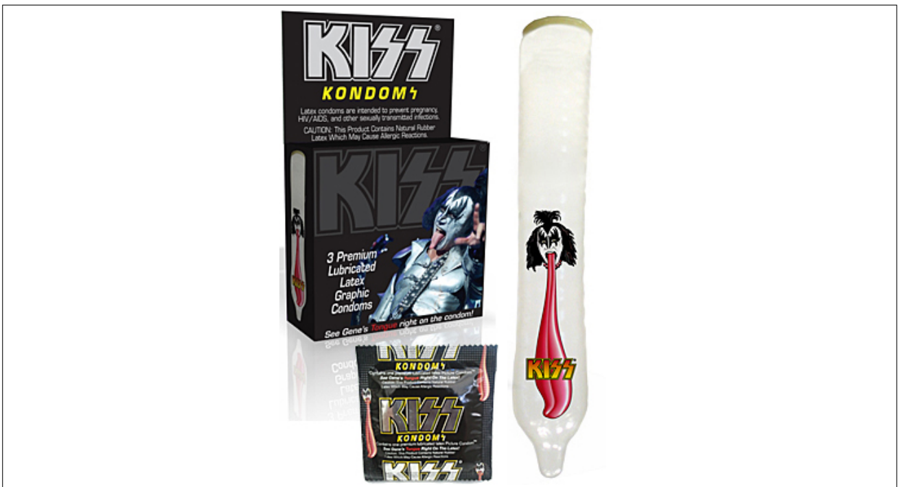
Рис. 2: Кто хотел повертеть кумира на хую?